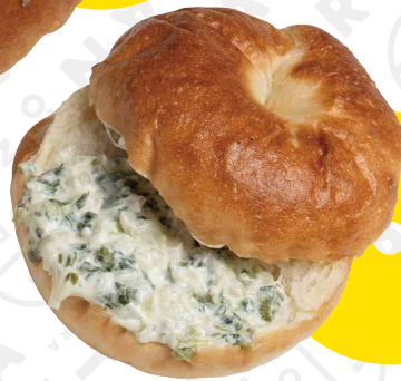
파(ネギ)ベーグル 韓国で大人気のネギクリーム (ネギとクリームチーズ)入り