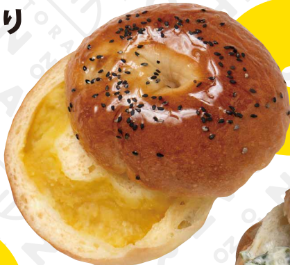
スイートポテトベーグル 濃厚な甘味の芋餡入り