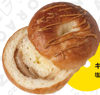
キャラメルベーグル 塩キャラメルクリームたっぷり