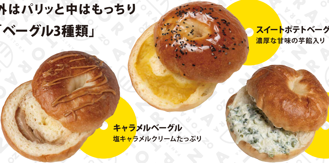
キャラメルベーグル 塩キャラメルクリームたっぷり